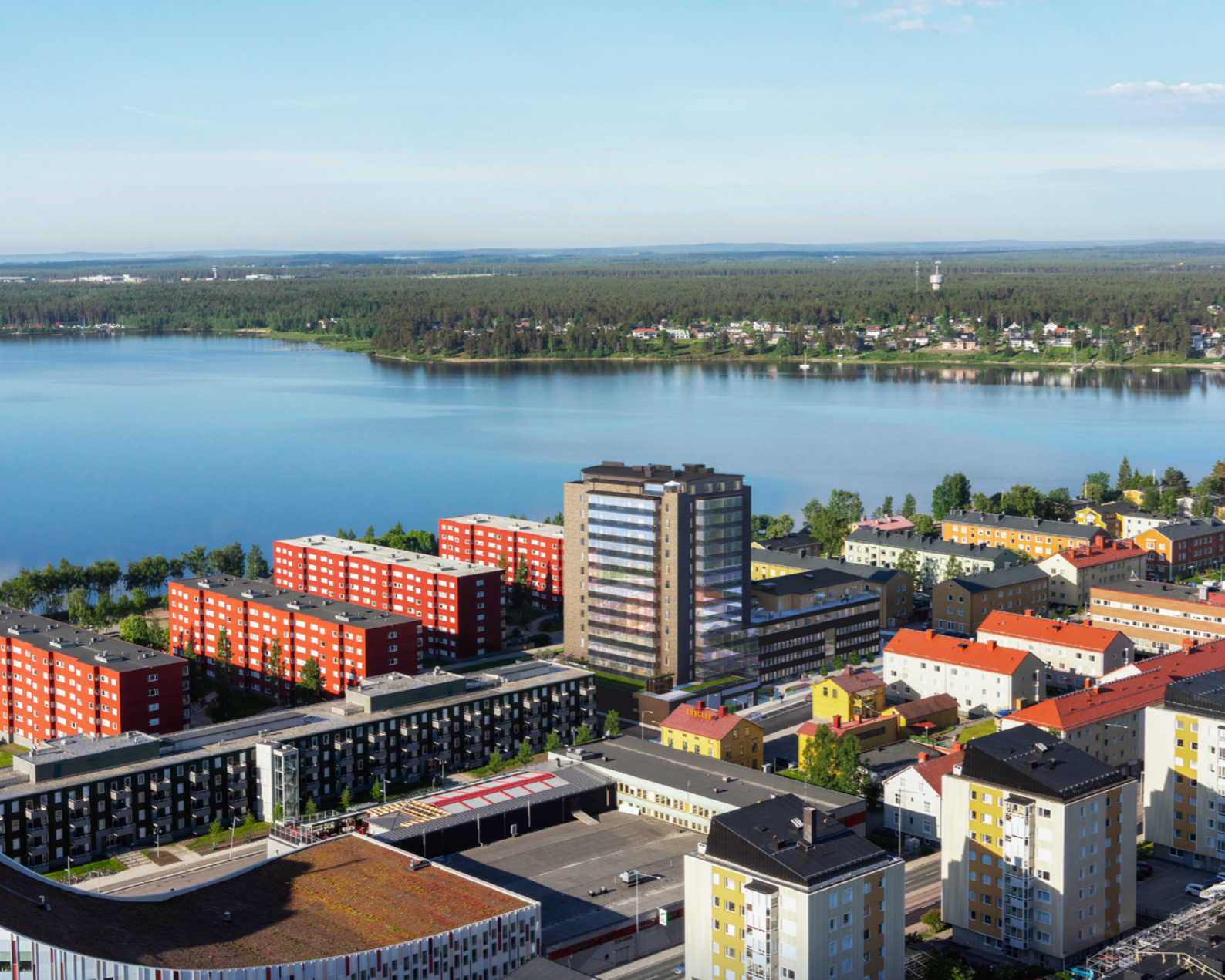
Med en kort promenad från Hägern 11 till Luleå Centrum.